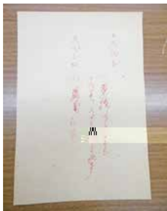
写真2 本書p. 6欄外に記載されている「スズシ」の注釈を示す柳田國男のコメントの断片

さらに、「牧野老博士」(本書中の前後の記述より植物学者牧野富太郎(1862-1957)と推定される)に対し、元原稿を送って意見を仰いでいる。本書に以下の記述がある。