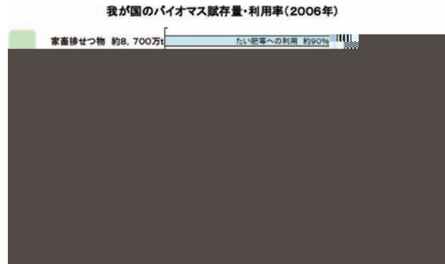
図1 2006年農林水産省発行のわが国のバイオマス賦存量に関する資料

バイオマスは大別して生産系と未利用資源系に分けられる。生産系は陸域系と水域系からなり、陸域系は地上で栽培する糖質系のサトウキビやデンプン系トウモロコシなどがあり、水域系では淡水のホテイアオイ、海洋系のマコンブなどがある。また未利用資源系は農林水産系と廃棄物系に分けられ、農林水産系には稲わらなどの農