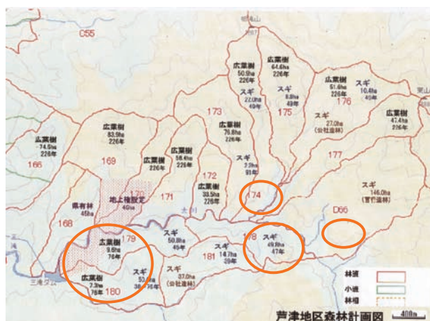
図3 芦津財産区の菌類採集地：オレンジのサークルは採集地点を表す

月から11月後半まで行った。これまでの菌類調査の結果、スギ人工林から Hypholoma sublateritium (クリタケモドキ)、 Hypholoma fasciculare (ニガクリタケ)、 Inocybe umbtratica (シロニセトマヤタケ)、 Laetiporus sulphureus (マスタケ)、 Oligoporus caesius (アオゾメタケ)、 Oxyporus cuneatus (ヒメシロカイメンタケ)、 Pholiota lubrica (チャナメツムタケ)、 Pleurocybella porrigens (スギヒラタケ)、 Psathyrella gracilis (ナヨタケ)、 Strobilurus oshimae (スギエダタケ)、 Trametes orientalis (クジラタケ)、 Trametes versicolor (カワラタケ) の子実体を採取することができた。これらは広葉樹林内で採取した子実体30種以上に比べると極めて少ない。日本のスギ人工林における生物多様性の研究は動物のみならず菌類の観点から見ても興味深い。