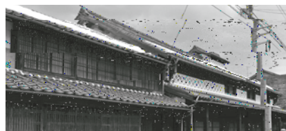
写真2：民芸館とカリヤ通り

カリヤを活かした活用例は、他に「休憩交流処かりや」の中に開業したダイニングカフェがある。若桜町で得られる食材を使ったメニューにこだわり、地域の老若男女と外からの客も呼び込む。民家改修の情報展示、建物見学も可能で、訪れた客の興味をそそる。