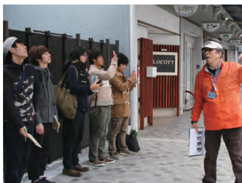
写真9 豊岡まちあるきガイド (2014年)

巡検後、11月20日(木)、12月4日(木)の2回、鳥取環境大学まちなかキャンパスを拠点に土地利用調査を行った(写真12)。調査対象地域は鳥取駅から鳥取県庁に続く駅前通り商店街、若桜街道商店街を中心に北西は智頭街道商店街、瓦町商店街、瓦町太平線商店街、南東は弥生橋通りに囲まれたエリアとし、ここを17区画に分割して一人につき1区画を調査した。調査は順調に進み、多くの学生は一度の調査で終えた。そのため2回目は、土地利用調査を終えた学生の調査を景観調査に変更した。