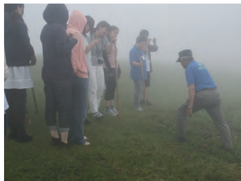
写真15 事前学習の様子(2014年)

本巡検は7月4日(金)夜に米子にある本学西部サテライトキャンパスにて約1時間の事前学習を行った(写真15)。参加学生はプロ研1・3を受講する学生16人、島根県立短期大学2人、