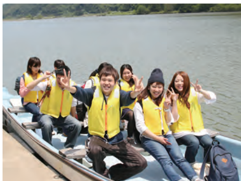
写真1 渡船で玄武洞公園へわたる （2014年，新名撮影）

次に、ジオサイトごとに8チーム（鳥取砂丘、湖山池、雨滝・国府、浦富海岸、青谷、鹿野、気高、湯村温泉）に分け、文献やウェブサイトでの事前調査を行い、サイトの概要を整理した。その後、地域間比較のため2014年5月24・25日（土日）に1泊2日の山陰海岸ジオパーク但馬巡検を行った。これまでは教員が運転する公用車1台で行う日帰り広域巡検を行っていたが、今回は人数も多く、複数回の日程調整が必要となるため、一度に全員で1泊2日巡検を行うこととした。ここ