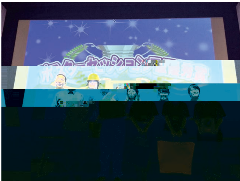
ポスターセッションで最優秀賞を受賞

2014年夏、鳥取環境大学の学生有志が「大学生観光まちづくりコンテスト2014西日本ステージ」へ参加し、ポスターセッション最優秀賞を獲得した。筆者はその担当教員として、彼らとともにコンテストに参加した。ここでは、コンテストの参加を通して得られた教育的な効果や課題を整理しておきたい。また、コンテストがもたらす地域振興の効果についても若干考察する。