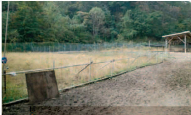
(左 ダチョウ施設 右 ダチョウ放牧場 現在は、放牧養豚の実験設備)