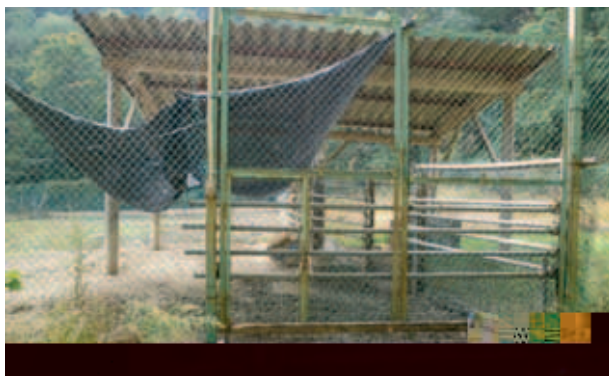
(左 ビニールハウスを利用した豚舎 右 放牧場の水場餌場)

ていかないので失敗した。フェンスについては電気柵でなく日垂フェンスを利用している。他の実験で、電気柵をにして電に柵の の なをて、 に はしないている。