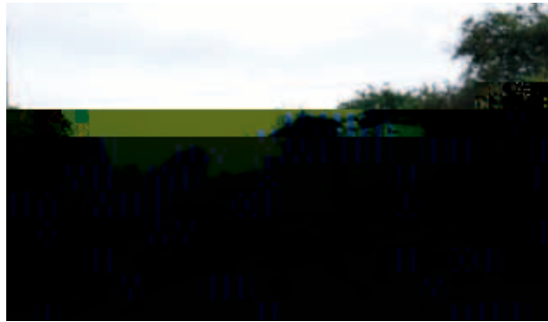
(上 放牧の様子。下 豚舎に利用している廃コンテナ)