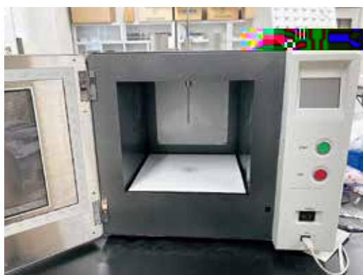
図1 マグネトロン式マイクロ波照射機 （ \mu Reactor-EX、四国計測工業）

マイクロ波照射にはマグネトロン式マイクロ波照射機の \mu Reactor-EX（四国計測工業、10W ~ 1000W）と、半導体式マイクロ波照射機のHPA-100W STD System（クロニクス、0W ~ 100W）を用いた。図1、図2にマイクロ波照射機の外観を示す。