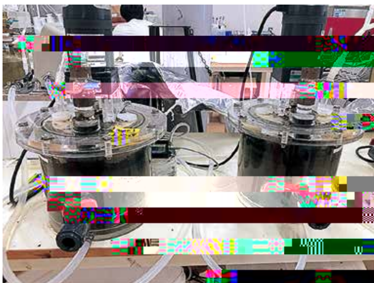
図6 連続式反応器（有効容積2L）

実験には有効容積2Lの連続式反応器を2槽用い、槽内汚泥へのマイクロ波照射を行わない未照射系と平日1日1回200gの槽内消化汚泥を引抜き、MWを照射後に（期間1:50 W 6 min、期間2:100W 3min）槽内に戻す処理を行ったMW照射系の2系列での実験を実施した。HRTは50日とした。図6に連続式反応器を示す。